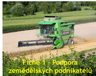
Fiche 1 - Podpora zemědělských podnikatelů