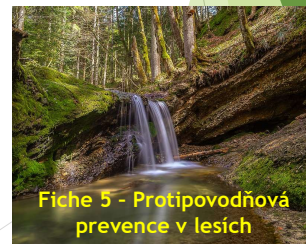
Fiche 5 - Protipovodňová prevence v lesích