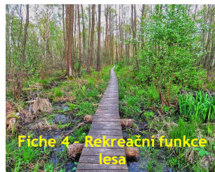
Fiche 4 - Rekreační funkce lesa