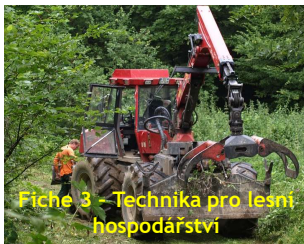
Fiche 3 - Technika pro lesní hospodářství