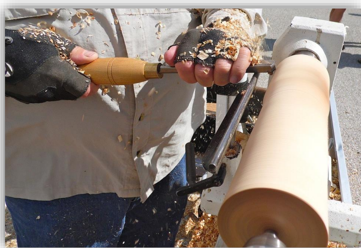
Fiche 2 – Rozvoj nezemědělského podnikání