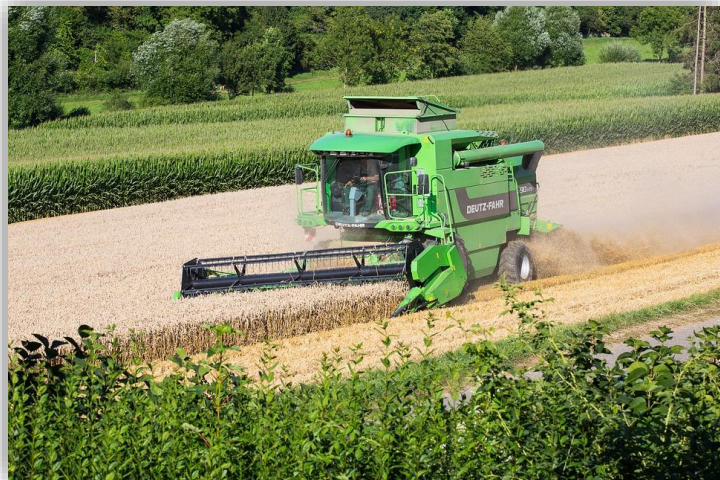
Fiche 1 – Podpora zemědělských podnikatelů