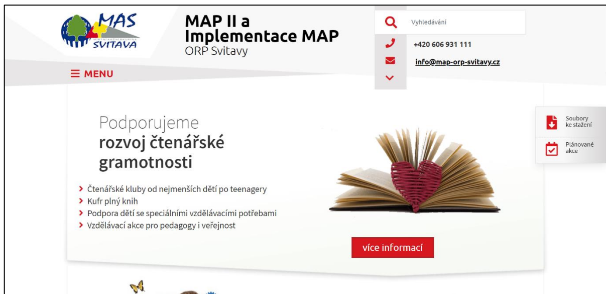
Obrázek: Úvodní strana webových stránek projektu MAP II a Implementace MAP ORP Svitavy