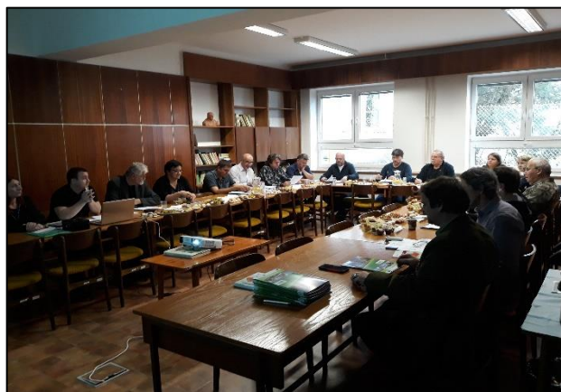
Obrázek - Valná hromada konaná dne 19. 11. 2019

Jednání proběhlo 19. 11. 2019 a hlavním bodem bylo projednání návrhu změny SCLLD v návaznosti na výstupy z evaluace, dále činnost MAS, volba nových členů, apod.