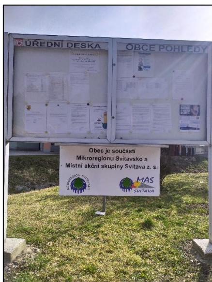
Obrázek – Úřední deska v obci Pohledy

Nedílnou součástí projektů jsou nadále i karty zrealizovaných projektů, které jsou šířeny do území a významně napomáhají k propagaci a plnění komunikačních plánů projektů (volitelná příloha výzev PRV a ML).