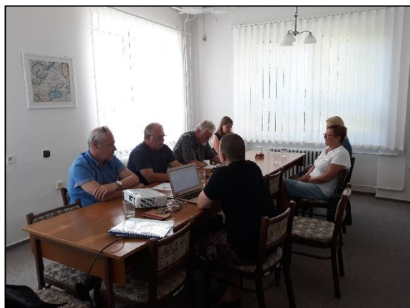
Obrázek - Jednání Rady konané dne 19. 06. 2019