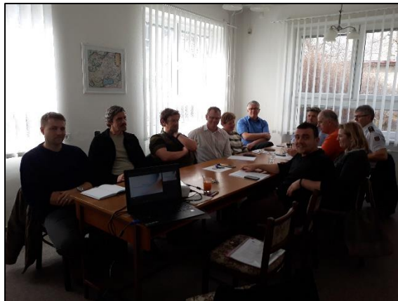
Obrázek - Jednání Výběrové komise konané dne 26. 03. 2019