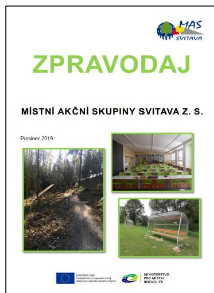
Obrázek – Zpravodaj