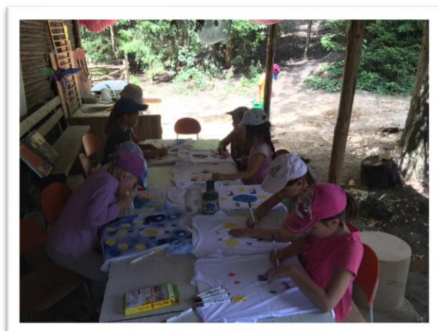
Obrázek - 2. výzva z OPZ (Příměstské tábory v přírodě)