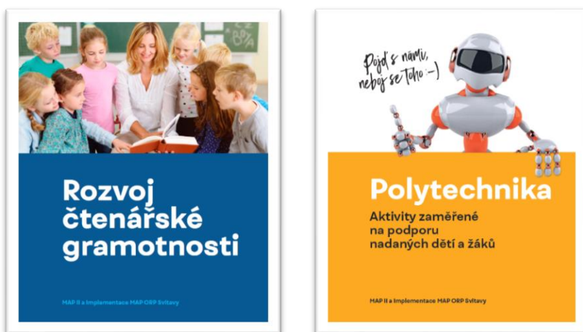
Obrázek - Propagační brožurky na aktivity čtenářské gramotnosti a polytechniky

Plánovanými aktivitami jsou zejména aktivity zaměřené na rozvoj čtenářské gramotnosti, na podporu nadaných dětí a žáků v oblasti polytechniky, na společná setkávání ředitelů škol, na vzdělávání pedagogických pracovníků a na spolupráci s neziskovými organizacemi.