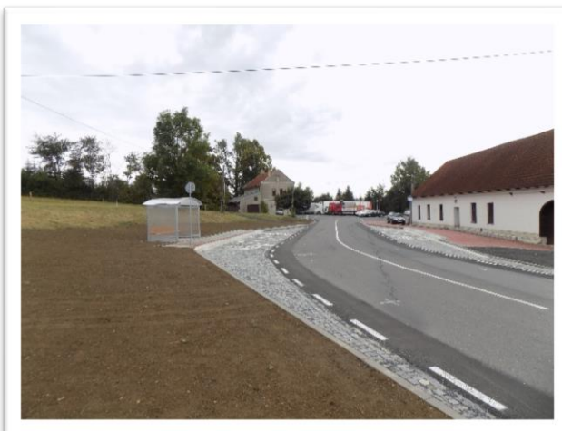
Obrázek - 1. výzva z IROP (Řešení bezpečnosti chodců u komunikací v obci Koclířov)