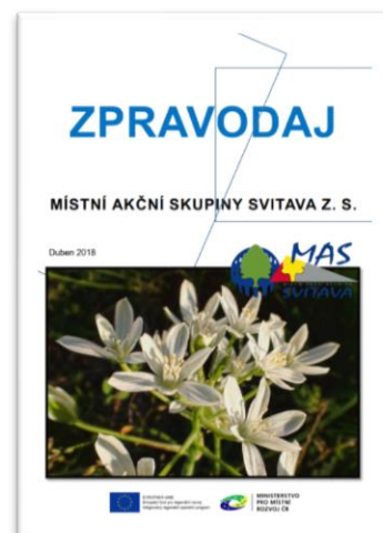
Obrázek - Zpravodaj

Nedílnou součástí projektů se staly karty zrealizovaných projektů, které jsou šířeny do území. Dále významně k propagaci napomáhá plnění komunikačních plánů projektů (volitelná příloha výzev PRV a ML).