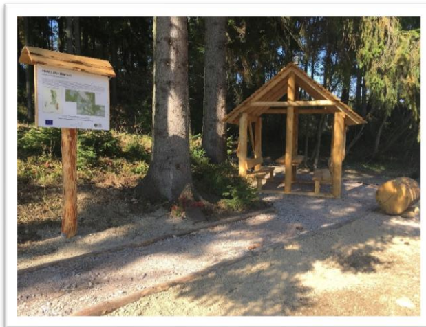
Obrázek - 1. výzva z PRV (Zřízení odpočinkového místa u pramene řeky Třebovky)