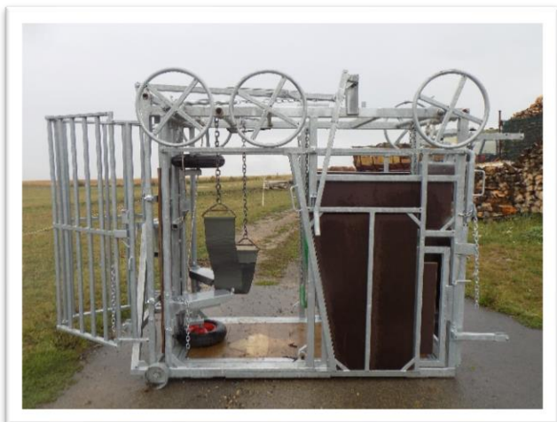
Obrázek - 1. výzva z PRV (Fixační klec na ošetřování paznehtu u skotu)