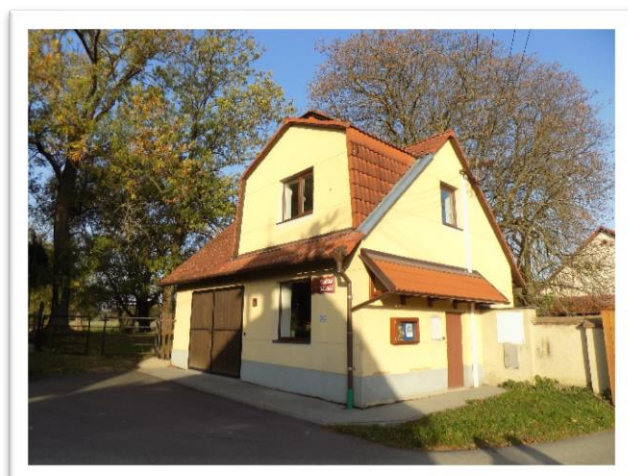
Obrázek - ML 2018 (Oprava hasičské zbrojnice ve Študlově)