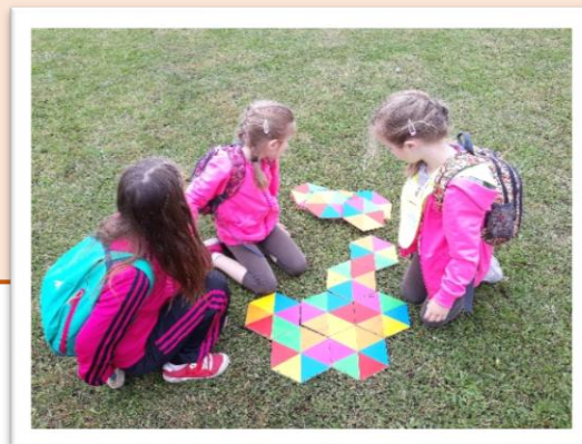
Obrázek – Den IZS ve Svitavách, 27. 6. 2018