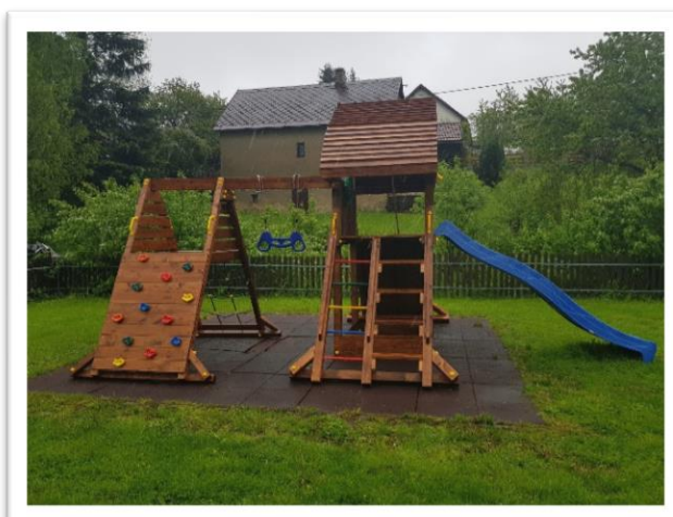
Obrázek - ML 2018 (Oprava dětského hřiště u obecního úřadu)