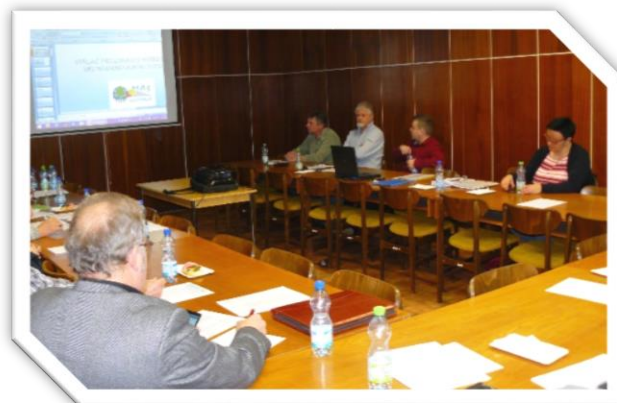
Jednání Valné hromady MAS Svitava

3. 3. Zpráva o činnosti MAS Svitava v období od minulé valné hromady, Projednání a schválení Strategie komunitně vedeného místního rozvoje Místní akční skupiny Svitava z. s. pro období 2014-2020