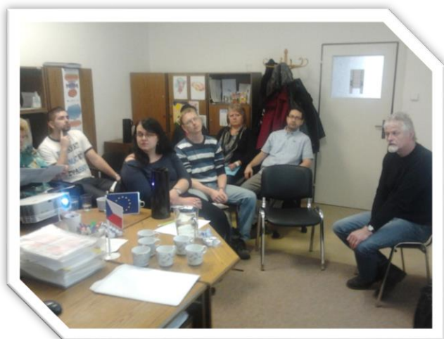
3. 3. Schválení Strategie SCLLD Místní akční skupiny Svitava z. s. nejvyšším orgánem MAS