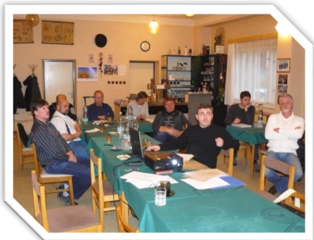
23. 2. Veřejné projednání strategie v mikroregionu Brněnec, Chrastavec