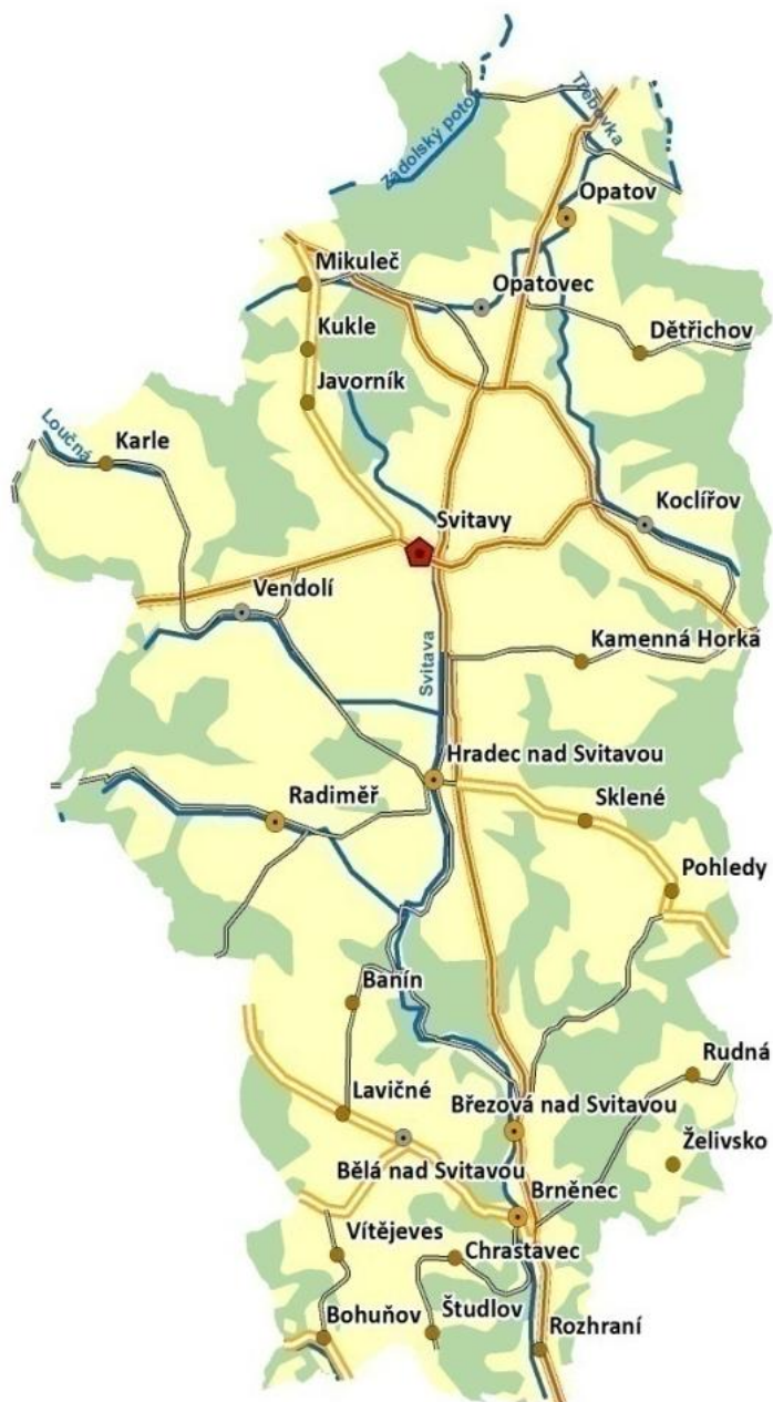
Území MAS Svitava