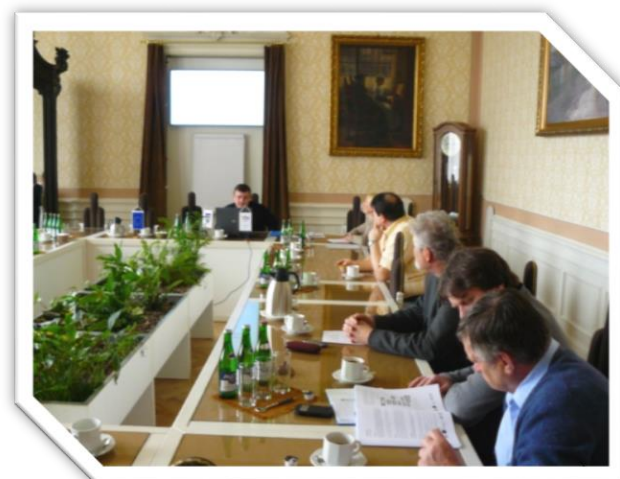
2. 3. Veřejné projednání strategie s poskytovateli sociálních služeb