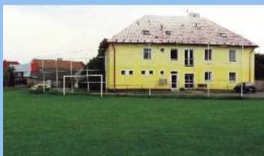
7. Obnova hřiště, TJ Sokol Vendolí