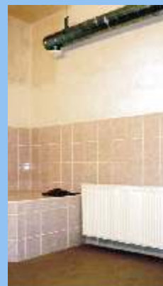
2. Sušárna obuvi a oděvů v MŠ Vendolí