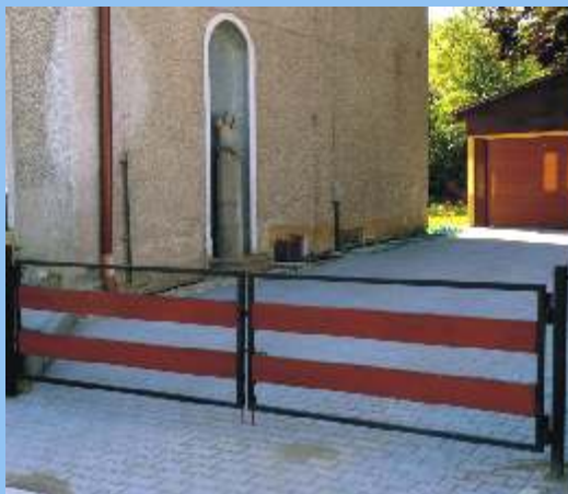
5. Odvodnění a zpevnění plochy RSS Svitavy