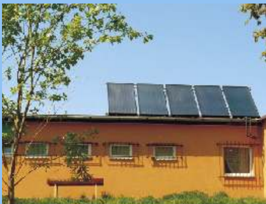
1. Hygienické zařízení kabin TJ Radiměř