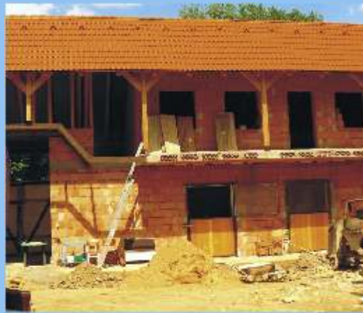
4. Stavební úpravy zemědělské usedlosti Vendolí