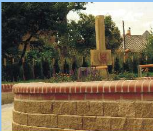
3. Úprava veřejného prostornství ve Vítějevi