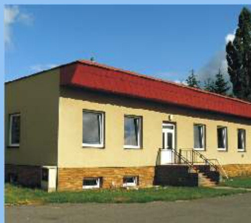
6. Klubové zařízení ČSCH ZO Vendolí