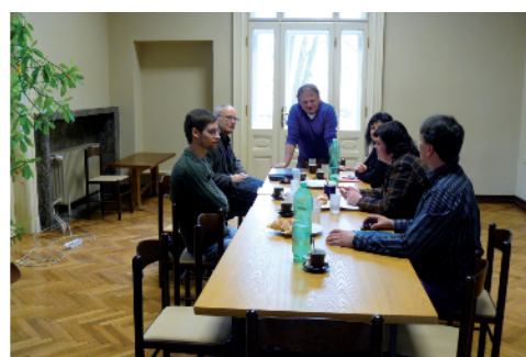
Schůzka koordinační skupiny ve Svitávce

Dvě vily Löw-Beerů stojí ve Svitávce a další je v Brně, v sousedství známé a nedávno restaurované vily Tugendhat. Obě brněnské stavby zajišťoval Alfred Löw-Beer, když vilu Tugendhat stavěl pro svou dceru Gretu, která se do rodu Tugendhat provdala. Löw-Beerové postavili pro své úředníky a dělníky také několik objektů pro bydlení v Půlpecnu, Brněnci a Bělé nad Svitavou a poskytovali peněžité dary k humanitárním účelům.