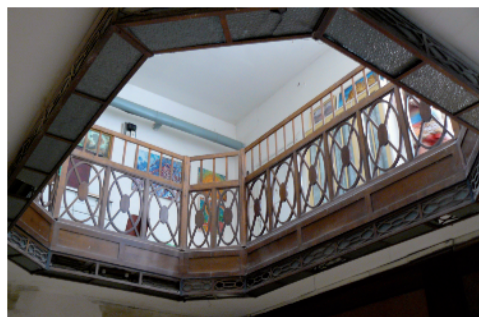
Zajímavý interiér vily v Půlpecnu