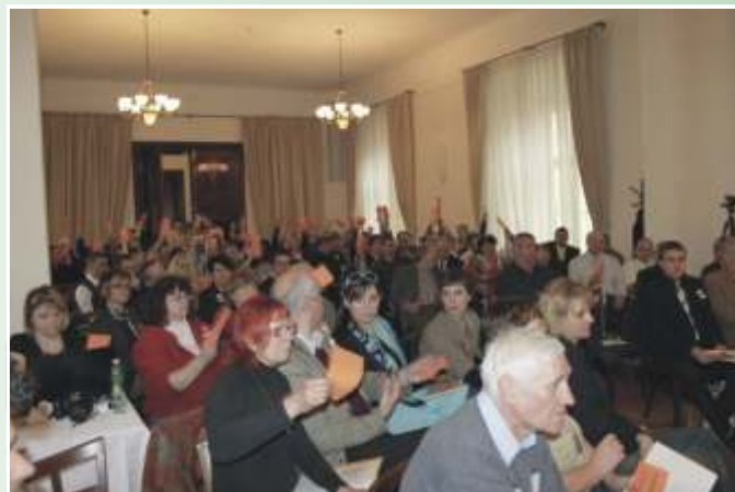
Delegáti valné hromady v jednacím sále zámku ve Křtinách