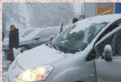
Na Monínci už padal sníh, byť převážně technický