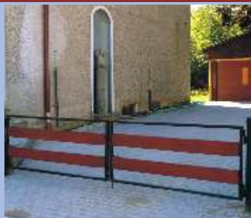
Odvodnění a zpevnění pozemku a propagační plochy u budovy RSS Svitavy fiche č. 5 Žadatel: Regionální sdružení sportů Svitavy Celkové způsobilé výdaje: 240.000 Kč Přiznaná výše dotace: 216.000 Kč