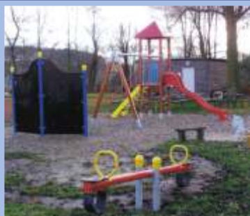
Dětské hřiště Radiměř fiche č. 5 Žadatel: Obec Radiměř Celkové způsobilé výdaje: 255.057 Kč Přiznaná výše dotace: 182.317 Kč