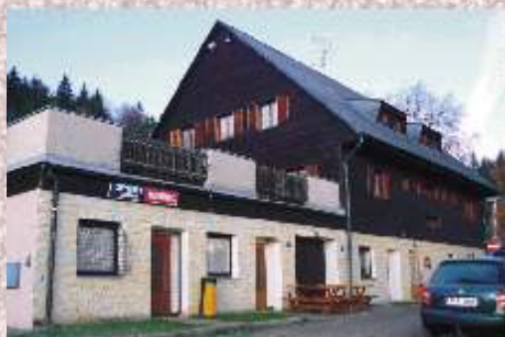
Ubytování v lyžařském areálu Monínec