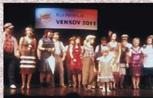
Večerní vystoupení sedlčanského divadelního souboru