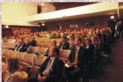
Pohled do jednacího (divadelního) sálu Kulturního domu Josefa Suka v Sedlčanech