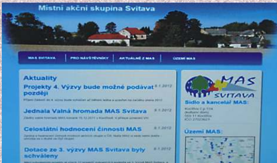
Nové www stránky MAS ve zkušebním provozu na fotografii