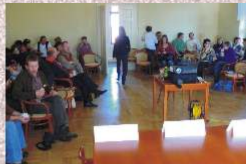
Jednání pracovní skupiny Venkov, rodina a tradice na zámku Odlochovice