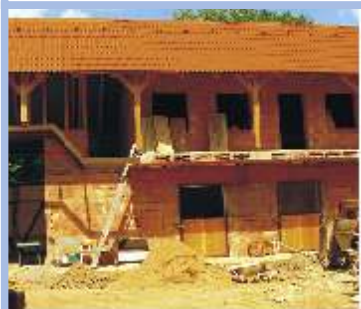
Stavební úpravy RD-zemědělské usedlosti Vendolí č.p. 18, I. etapa fiche č. 5 Žadatel: Občanské sdružení Bonanza Celkové způsobilé výdaje: 1,560.000 Kč Požadovaná výše dotace: 1,403,487 Kč (bude proplacena až společně s II. etapou)