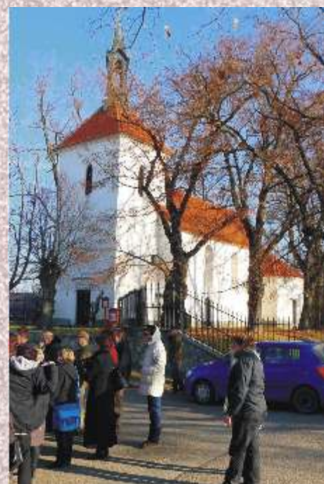
Návštěva ve Vesnici roku 2010 Ratměřičích