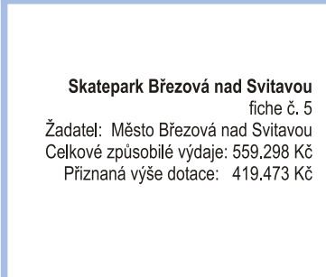
Skatepark Březová nad Svitavou fiche č. 5 Žadatel: Město Březová nad Svitavou Celkové způsobilé výdaje: 559.298 Kč Přiznaná výše dotace: 419.473 Kč