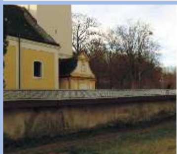
Oprava hřbitovní zdi ve Vendolí I. etapa fiche č. 6 Žadatel: Římskokatolická farnost Vendolí Celkové způsobilé výdaje: 922.782 Kč Přiznaná výše dotace: 830.503 Kč